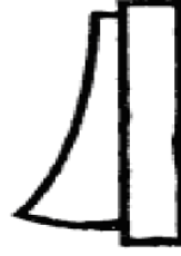
interruttore in posizione 1