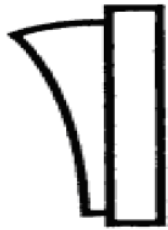
interruttore in posizione 0